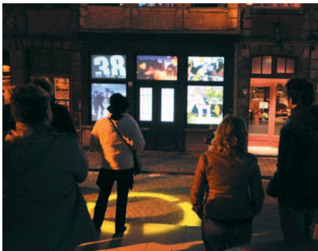
Lors de la fête de l'accordéon, l'an dernier, la prestation de VJ'ing avait impressionné.

Pour la fête de l'accordéon et dans la foulée, celle de la musique, la